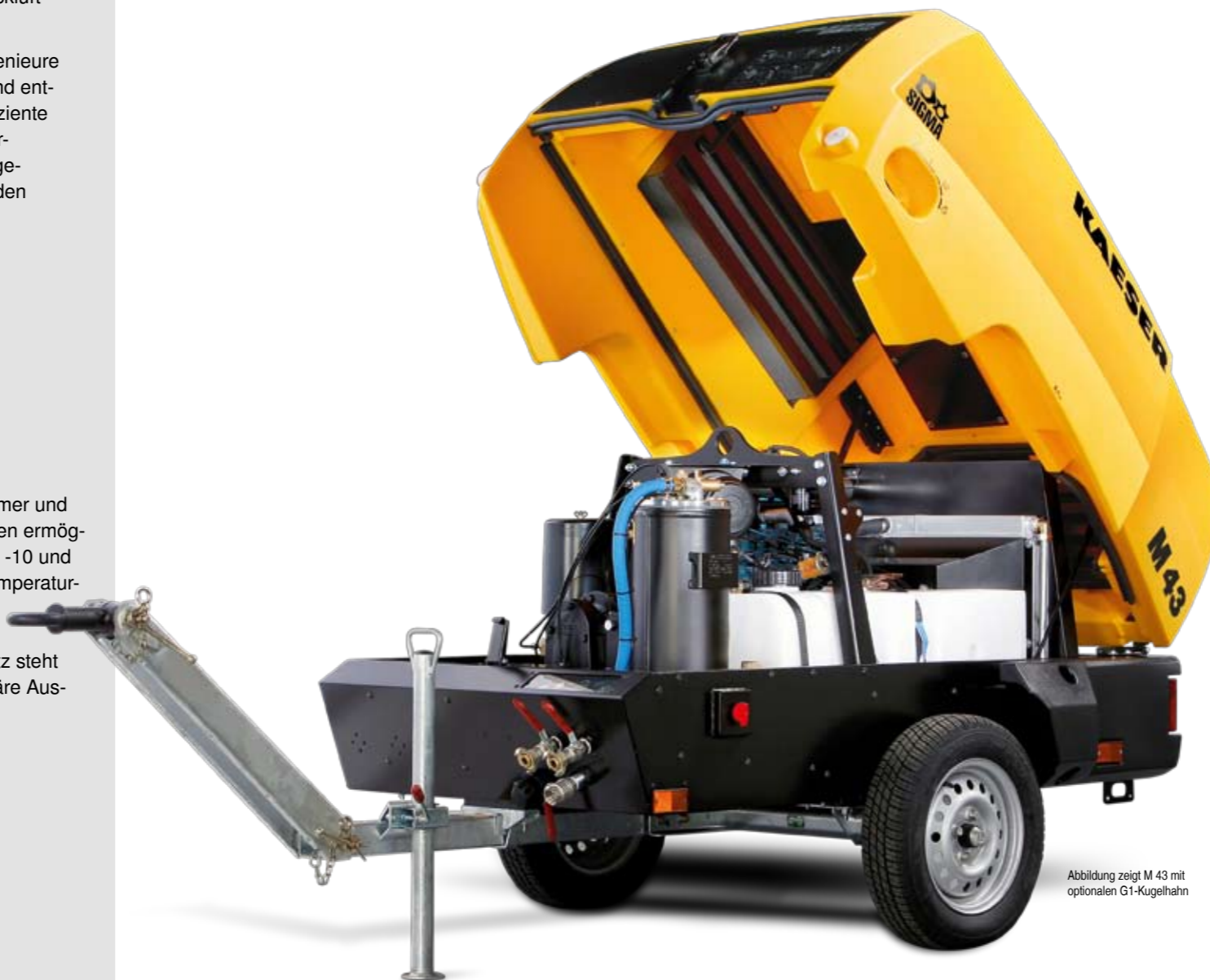
Abbildung zeigt M 43 mit optionalen G1-Kugelhahn